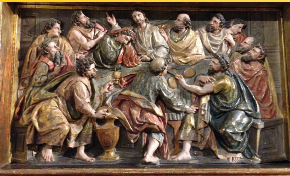
Foto del retablo del altar mayor de la Parroquia

Propiamente, el triduo pas-cual comienza con la misa vespertina de la cena del Se or, donde se conmemora la instituci n de la Eucarist a. A diferencia de la misa crismal, esta celebraci n se realiza en las parroquias y en las casas religiosas.